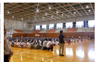
第72回全国レクリエーション大会 in 高知