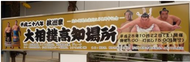
(平成28年大相撲高知場所の様子)