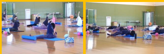
9/10ハタヨガ教室 無料体験会の様子

9月に秋のスポーツ教室 10 教室の無料体験会を開催しました。 1 期教室に参加して下さっていた方、スポーツ教室が初めてという方、合わせて 115 名の方にご参加頂きました。